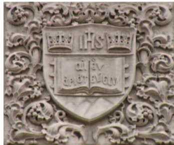
Το σύμβολο του Κολεγίου της Βοστώνης (ΗΠΑ)

• Στην είσοδο του Κολεγίου της Βοστώνης στη Μασσαχουσέτη , πάνω σε σκαλιστή πλάκα υπάρχει η επιγραφή: « Αιέν Αριστεύειν » (Ιλιάς Ζ στ. 208).