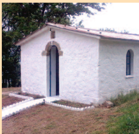
Ο ανακαινισμένος Αη-Γιώργης

✓ Ανήμερα της εορτής και επειδή ο καιρός επιδεινώθηκε με βροχές και ομίχλη, ο Κοινοτάρχης πρωί – πρωί ενήργησε αυτοψία και διαπίστωσε ότι ο δρόμος δεν ήταν προσβάσιμος στα μικρά επιβατικά οχήματα και ως εκ τούτου η λειτουργία μεταωθήκε.