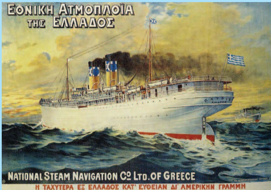
Το θρυλικό υπερωκεάνιο «Πατρίς» με το οποίο ταξίδεψαν οι Διλοφιώτες για την Αμερική

Θα πρέπει, εδώ, να αναφέρω ότι ακόμα και για τον παππού μου, οι πληροφορίες που έχω προέρχονται από τις αφηγήσεις της μητέρας μου. Ήμουν μικρή όταν πέθανε εκείνος, το 1963, και έτσι δεν γνωρίζω πολλά στοιχεία για τους μετανάστες αυτούς. Θα πρέπει ακόμη να προσθέσω ότι