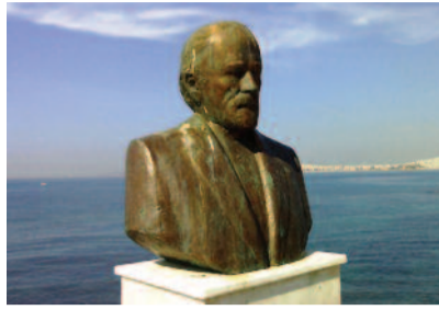
Μανώλης Ανδρόνικος Γλυπτό του Τάκη Παρλαβάντζα στο Φλοισόβο Παλαιού Φαλήρου.

Επίσης εργάστηκε στην Υπηρεσία Αναστηλώσεων για τον καθαρισμό και διάσωση Βυζαντινών και μεταβυζαντινών μνημείων. Υπήρξε Ροταριανός, όπου διετέλεσε μέχρι Πρόεδρος στον