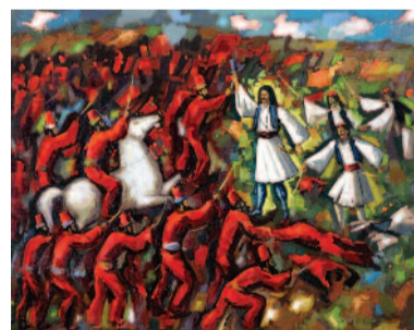
Έργο του Τάκη Παρλαβάντζα « Η μάχη της Αλαμάνας »

Το 1961 και 1962, με υποτροφία του Πανεπιστημίου Αθηνών σπούδασε στο Παρίσι. Στο διάστημα αυτό ταξίδεψε και μελέτησε τα μουσεία για την σύγχρονη τέχνη στην Ολλανδία, Βέλγιο, Γαλλία και