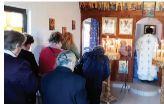
Από την εορτή του Αγ. Κωνσταντίνου