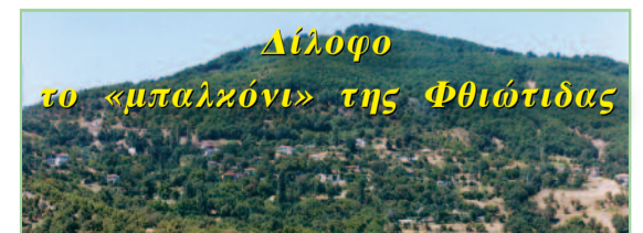
Δίλοφο το «μπαλκόνι» της Φθιώτιδας

Όσοι Διλοφιότες ή Αγιοσωστιανοί επιθυμούν να δημοσιευθεί στην εφημερίδα μας κάποιο κοινωνικό γεγονός (π.χ. γάμος, γέννηση, θάνατος, επιτυχία σε ΑΕΙ-ΤΕΙ κ.λπ.) μπορούν να επικοινωνήσουν στην παρακάτω διεύθυνση: Εκδόσεις-Γραφικές Τέχνες Καρούζη Αριστέα & Υιοί Ο.Ε. Θεοδοσίου 23 & Ελλησπόντου Ίλιον Τ.Κ. 13121 τηλ.-fax: 210-2619003 & 210-2619696 e-mail: karpouzi@otenet.gr