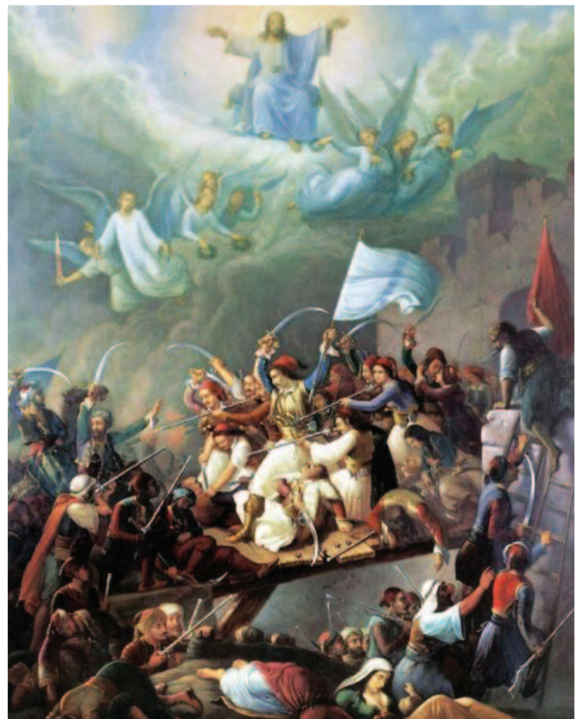
10 Απριλίου 1826 - Η ηρωικότερη στιγμή του Αγώνα, η Έξοδος του Μεσολογγίου