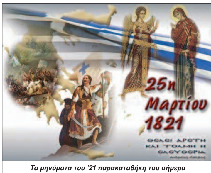
Τα μηνύματα του '21 παρακαταθήκη του σήμερα

Σας περιμένουμε να τα ανακαλύψετε. Ραντεβού φέτος στις 17-8 στο Δίλοφο.