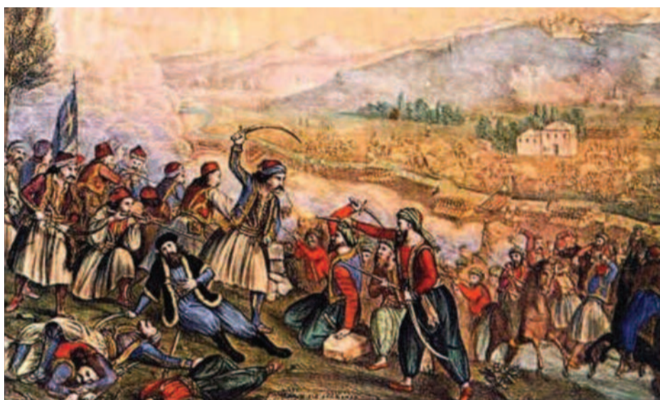
23 Απριλίου 1821 - Η Μάχη της Αλαμάνας

► 27 τιμήθηκαν με χάλκινο , ως υπαξιωματικοί . ► 66 τιμήθηκαν με σιδερένιο , ως στρατιώτες . Όμως κάποιοι από αυτούς δεν χαρακτηρίζονται ή δεν το είχαν λάβει .