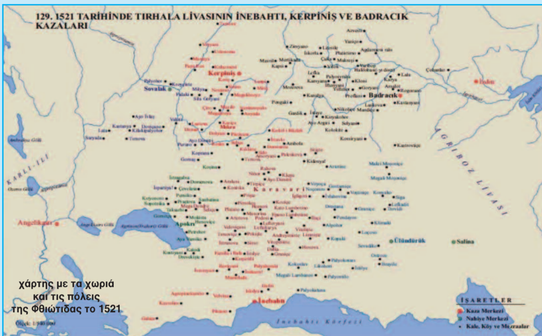
χάρτης με τα χωριά και τις πόλεις της Φθιώτιδας το 1521