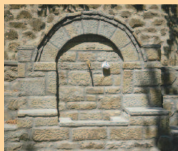
Η όμορφη παραδοσιακή θρύση που κοσμήει την πλατεία του χωριού μας

Κατά την διάρκεια της φετινής χρονιάς στο χωριό μας δημιουργήθηκαν τρία ωραία έργα: