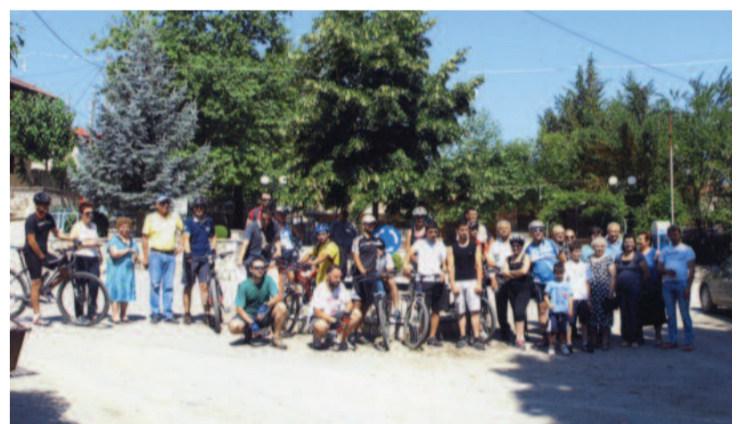
Από τη διέλευση ποδηλατιστών στις 23-6-2013 στα Μάρμαρα