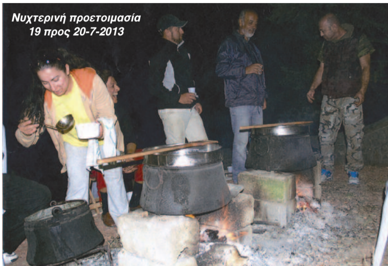
Νυχτερινή προετοιμασία 19 προς 20-7-2013

Ο χώρος καθαρός, το τοπίο μοναδικό και πανέμορφο, η θεία λειτουργία ταπεινή και γαλήνια.