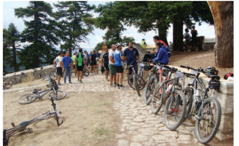
Οι ποδηλατιστές στη θέση «Στεφάνι» Μαρμάρων στις 7-9-2013