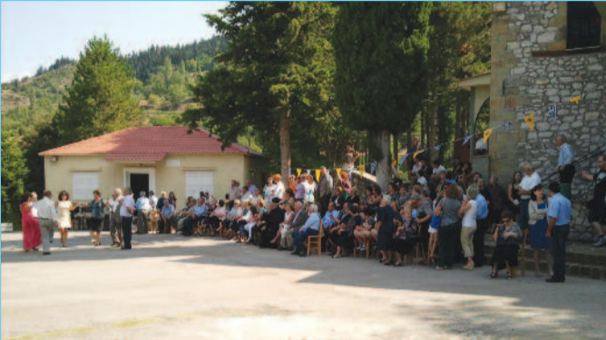
23-8-2013 μετά τον εκκλησιασμό