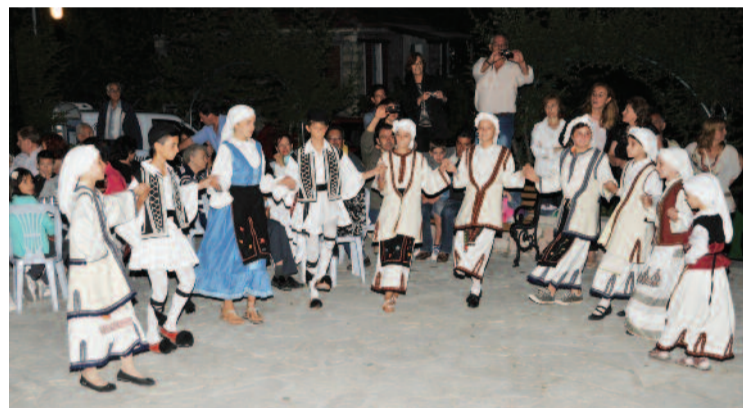
Παιδιά του χορευτικού Μαρμάρων