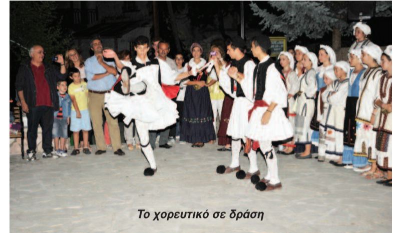
Το χορευτικό σε δράση

μασίας, ποιότητας και προσφοράς δεσμεμάτων, ποτών κ.λπ. αλλά και από άποψη έγκαιρης εξυπηρέτησης.