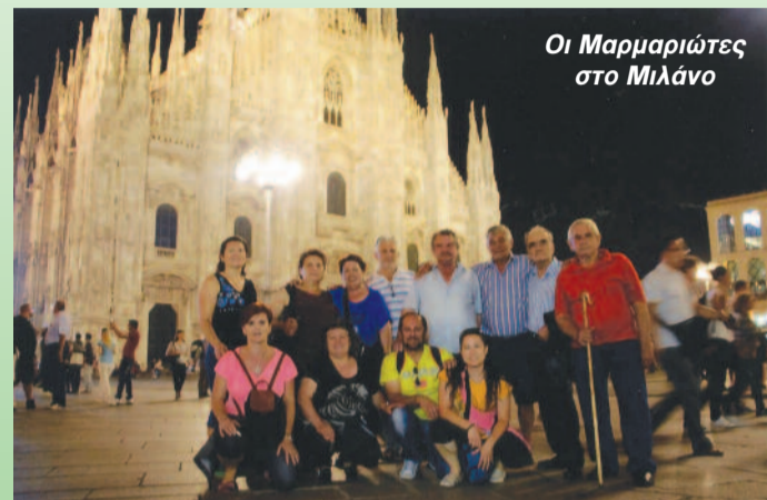
Οι Μαρμαριώτες στο Μιλάνο