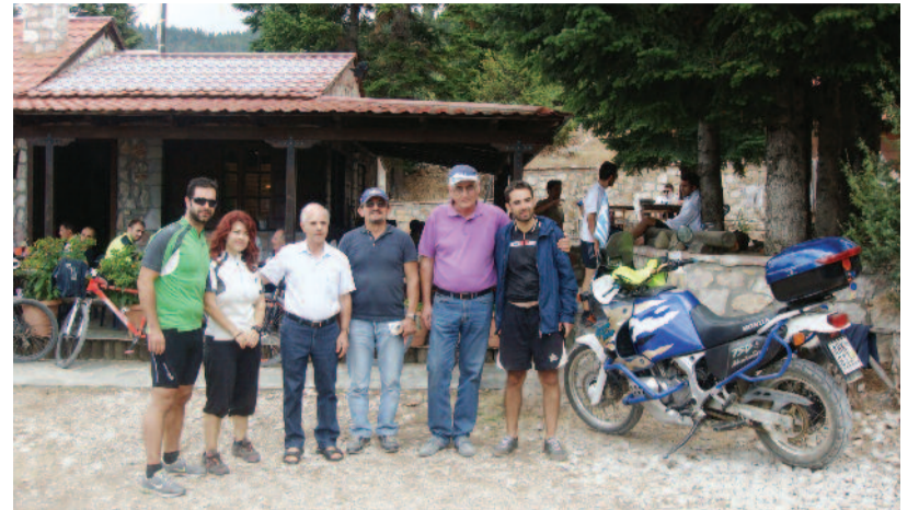
Στάση ποδηλατιστών στον «Αέρα» Μαρμάρων στις 7-9-2013