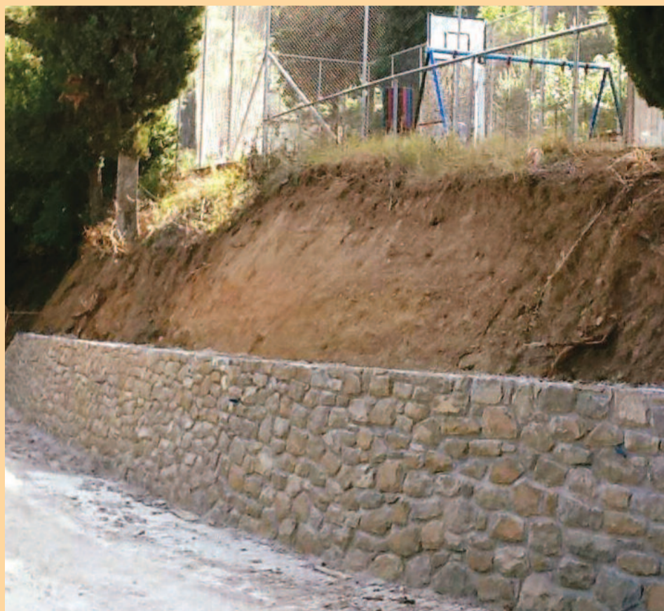
Το τοίχιο ολοκληρωμένο

Εν συνεχεία μεθοδικά και με κλίση, ώστε να μην διαχέονται στο οδόστρωμα τα όμβρια ή από τους παγετούς νερά, τσι-