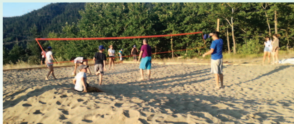
Το νέο γήπεδο του beach volley

Από το τουρνουά μπάσκετ στα Μάρμαρα . Οι ομάδες που συμμετείχαν ήταν: Μάρμαρα , Κυριακχώρι , Κολοκυθιά και Περιβόλι . Νικήτρια αναδείχτηκε η ομάδα της Κολοκυθιάς . Ευχαριστούμε τον κ. Παύλο Τζαννή και τα υπόλοιπα μέλη του Δ.Σ. για την πολύτιμη βοήθειά τους στη διεξαγωγή του αγώνα.