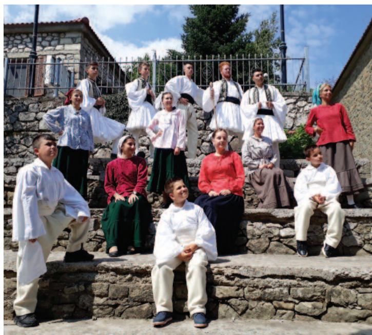
Λεβεντιές Κολοκυθιώτικες 2018

Λόγω πληθώρας ύλης οι καλοκαιρινές μας "εικόνες" θα ακολουθήσουν στο επόμενο τεύχος καθώς και η συνέχεια του "ΠΡΙΣΤΗΡΙΟΥ".