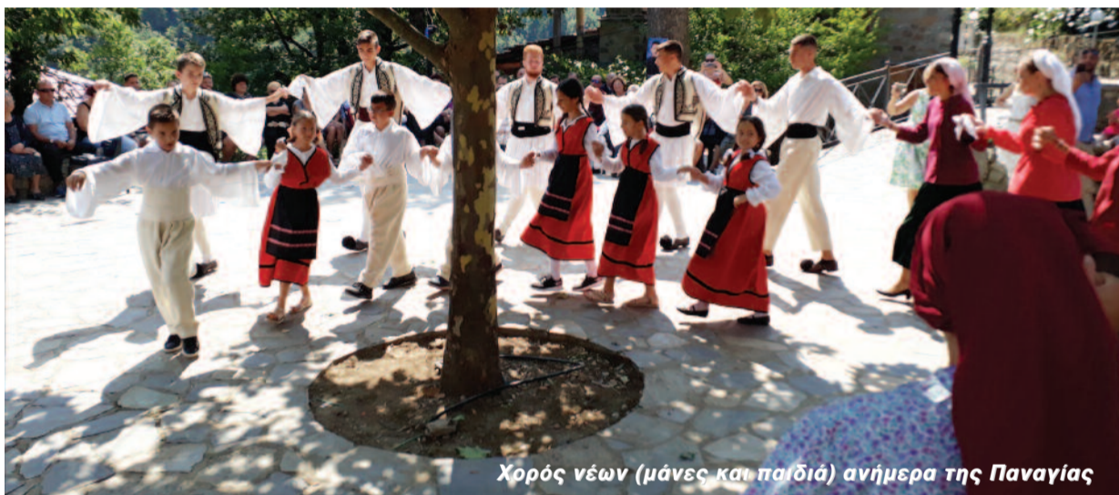
Χορός νέων (μάνες και παιδιά) ανήμερα της Παναγίας