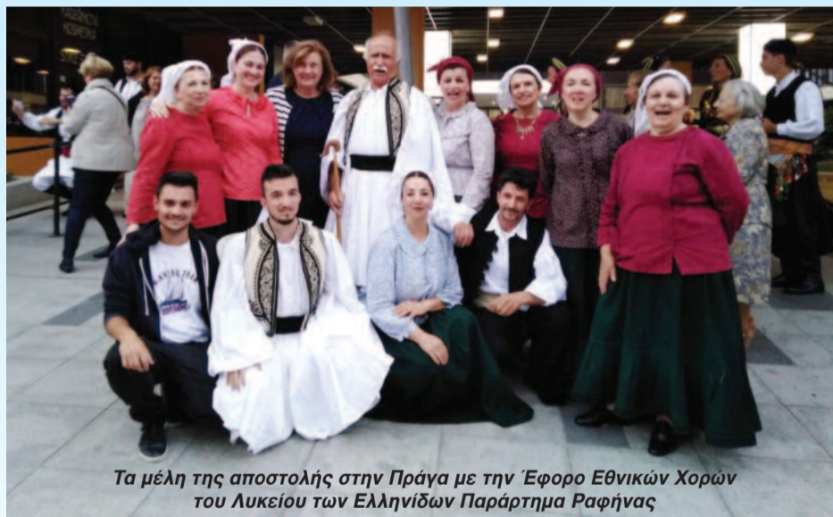
Τα μέλη της αποστολής στην Πράγα με την Έφορο Εθνικών Χορών του Λυκείου των Ελληνίδων Παράρτημα Ραφήνας

ότερο είναι ότι γίναμε όλοι μια παρέα που διασκέδαζε και συμμετείχε σαν να γνωρίζομασταν χρόνια. Όσον αφορά εμένα, θα μου μείνει αξέχαστο. Ευχαριστώ όλους τους διοργανωτές. Μεσ' από αυτό γνώρισαν πολλοί (έστω και εξ' αποστάσεως) την Κολοκυθιά. Θα χαρούμε να την γνωρίσουν και από κοντά.