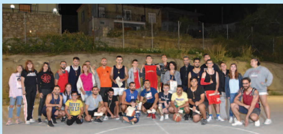
Από το τουρνουά μπάσκετ στο Κυριακοχώρι. Νικήτρια η ομάδα των Μαρμάρων.