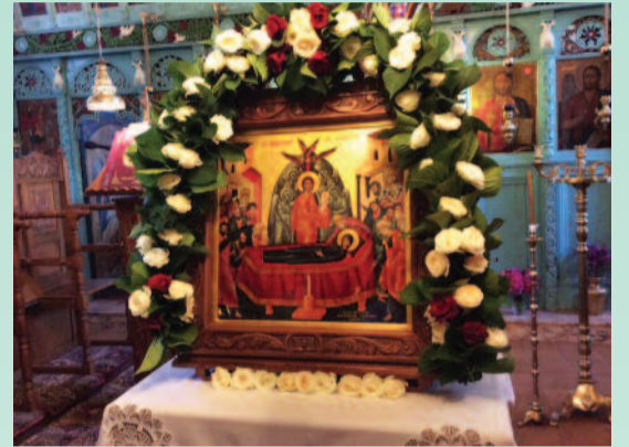
Η Παναγία στολισμένη

Μπορώ άφοβα να πω πως θυμάμαι και την παραμικρή λεπτομέρεια εκείνης της μέρας που τόσο περιμένα να έρθει! Αρχικά έλαβε χώρα η εκκλη-