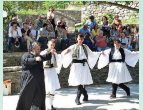
Ο παπα-Βασίλης όπως κάθε χρόνο ανοίγει τον χορό!