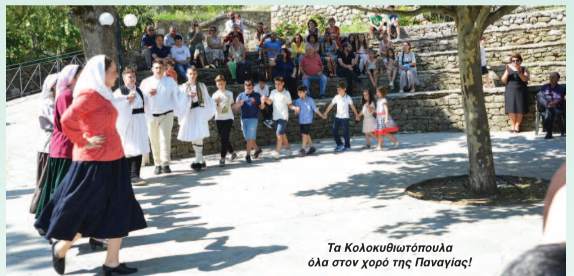
Τα Κολοκυθιωτόπουλα όλα στον χορό της Παναγίας!

σιαστική λειτουργία και μετά ακολούθησε το χορευτικό. Ένα αίσθημα εντυπωσιασμού με κατέκλυξε εκείνη τη στιγμή παρακολουθώντας τους χορευτές, θέλοντας να παρακολουθώ προσεκτικά τις κινήσεις τους. Υόστερα στο χορό συμμετείχαν και άλλοι χωριανοί και τότε έφτασε η ώρα όπου και εγώ μπόρεσα να σηκωθώ να χορέψω. Η περηφάνια και ο ενθουσιασμός που με διακατείχαν εκείνη τη μαγική στιγμή όπου χορεύεις στην πλατεία του χωριού σου είναι αναμφίβολα ένα μοναδικό και ανατικατάστατο συναίσθημα.