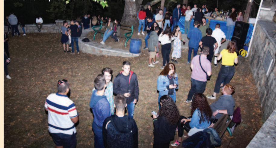
Από το πάρτυ νεολαίας στο Ρακαριό