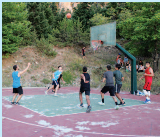
Από το τουρνουά μπάσκετ στα Μάρμαρα Κυριακοχώρι - Μάρμαρα - Κολοκυθιά - Περιβόλι. Νικήτρια η ομάδα της Κολοκυθιάς.