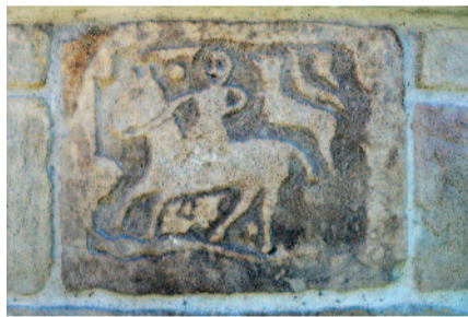
Σκηνή κυνηγιού: Οικία Παπανικολάου