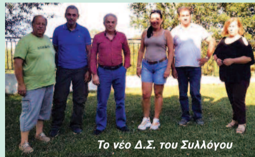
Το νέο Δ.Σ. του Συλλόγου

Μετά την πρώτη συνεδρίαση του Νέου Διοικητικού Συμβουλίου του ΕΞΩΡΑΪΣΤΙΚΟΥ & ΕΚΠΟΛΙΤΙΣΤΙΚΟΥ ΣΥΛΛΟΓΟΥ ΔΙΛΟΦΟΥ ΦΘΙΩΤΙΔΑΣ την Παρασκευή 14 Αυγούστου 2020, η νέα σύνθεσή του, που προέκυψε από τις αρχαιρεσίες της 13ης Αυγούστου διαμορφώνεται όπως φαίνεται παρακάτω: