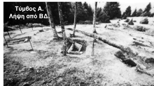
Τύμβος Α. Λήψη από ΒΔ.

Απόσπασμα από το βιβλίο "τα υπο-μυκηναϊκά νεκροταφεία των τύμβων των Μαρμάρων" παραθέτουμε στη συνέχεια.