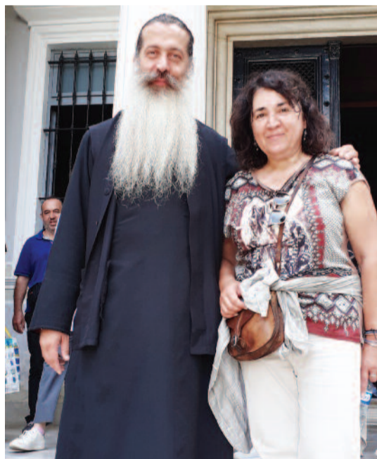
Στη Θεολογική Σχολή Χάλκης

πόνου στο νοσοκομείο Σωτηρία για τα παιδιά, τους φτωχούς, για την Εκκλησία και τα προβλήματα της κοινωνίας.