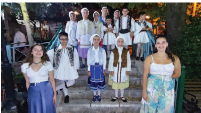
Από την χοροσπερίδα στις 19-8-2022