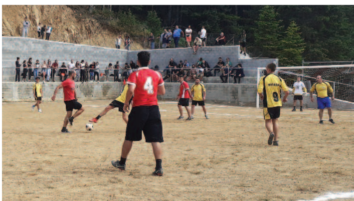
Τουρνουά ποδοσφαίρου στη Δάφνη στις 13-8-2022 (Αγώνες Μάρμαρα-Νεοχώρι)