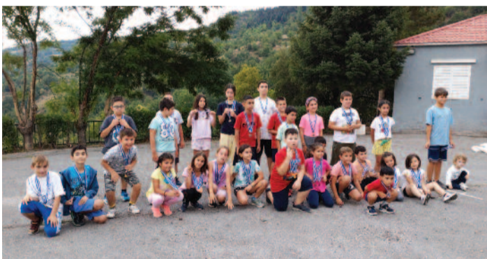
Από τους παιδικούς αθλητικούς αγώνες