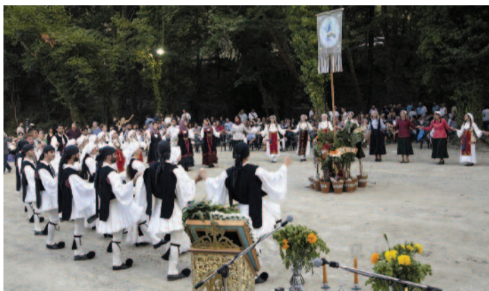
Από τον Τρανό Χορό της Αγάπης στο Περιβόλι στις 17-8-2022