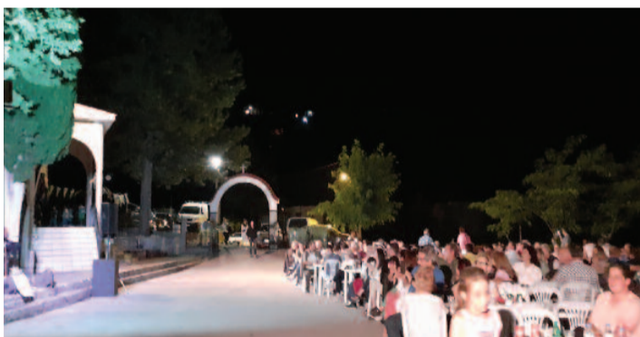
Γιορτή μελιού 19-8-2022