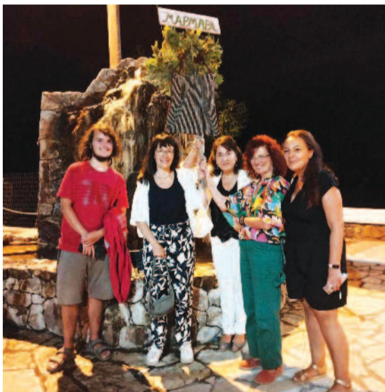
Από τον Τρανό Χορό στα Αργύρια στις 17-8-2023