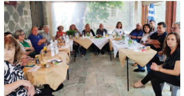
Συνάντηση των Δ.Σ. των 9 χωριών στα Αργύρια