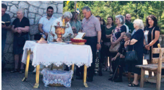
Εορτασμός Προφήτη Ηλία