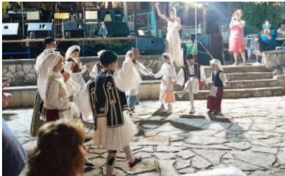
Το χορευτικό στη χοροσπερίδα στις 19-8-2023