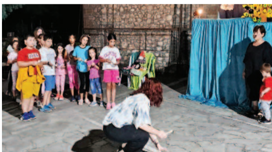
Από το κουκλοθέατρο