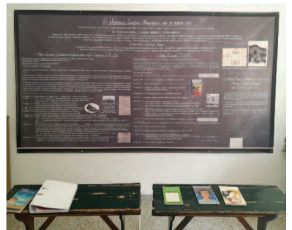
Έκθεση αρχειακών τεκμηρίων Δημοτικού Σχολείου Μαρμάρων από το βιβλίο των Γεν. Συνελεύσεων του ενοριακού ναού Παμ. Ταξιαρχών (1912-1940), από το αρχείο πρωτοκόλλου Δημ. Σχολείου και από το βιβλίο συσσιτίων