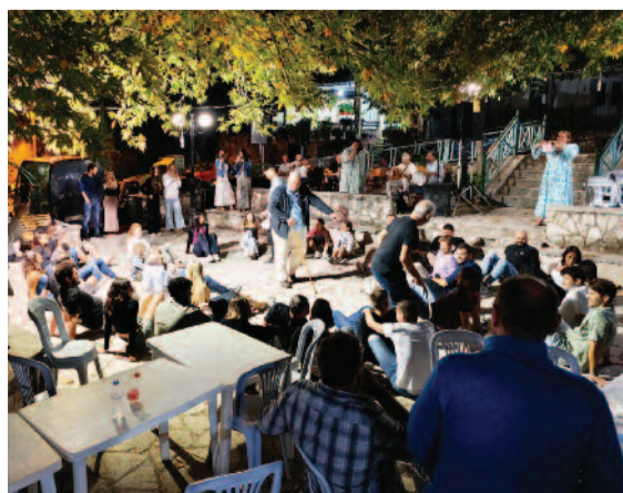
Από το πανηγύρι στις 23-8-2025