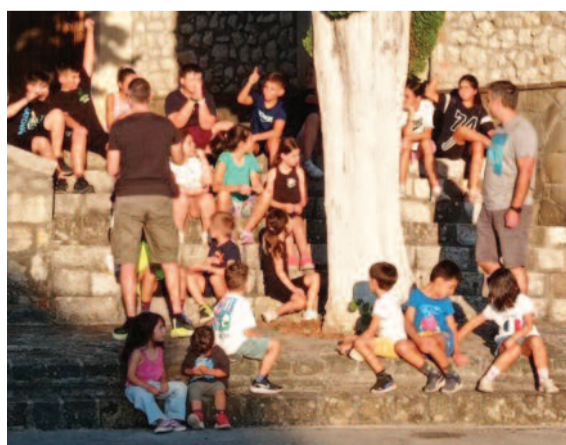
Από τους παιδικούς αθλητικούς αγώνες