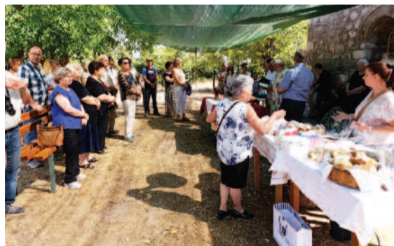
Από την Αγία Παρασκευή στις 26-7-2025