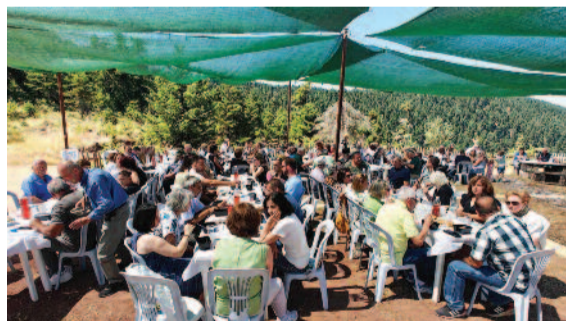
Από τον Προφήτη Ηλία στις 20-7-2025