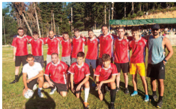
Από το τουρνουά ποδοσφαίρου στη Δάφνη