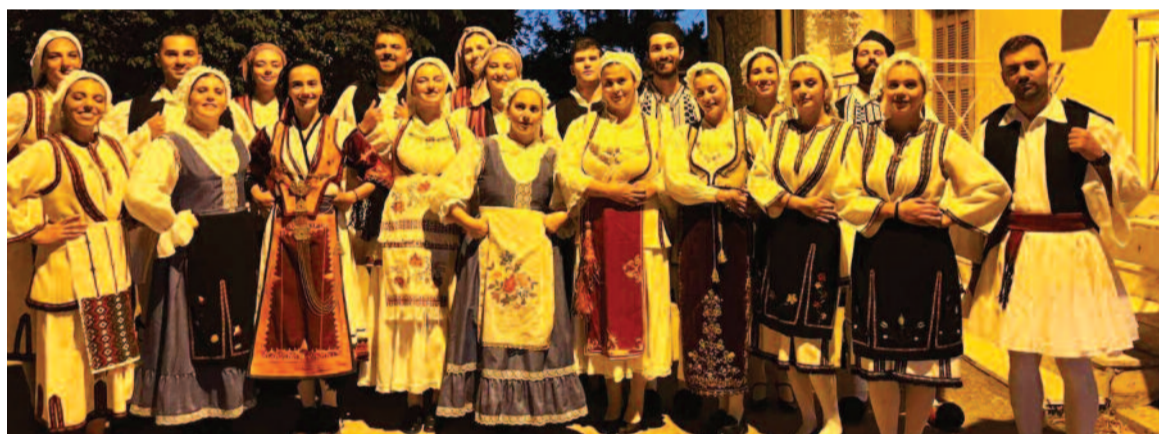
Από την εκδήλωση αναβίωσης των χορευτικών στις 16-8-2025