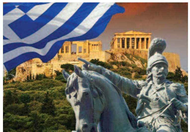
"Σήμερα γεννηθήκαμε και σήμερα θα αποθάνουμε για την ελευθερία της πατρίδας", φώναξε στους στρατιώτες του στα Δερβενάκια ο Θεόδ. Κολοκοτρώνης.