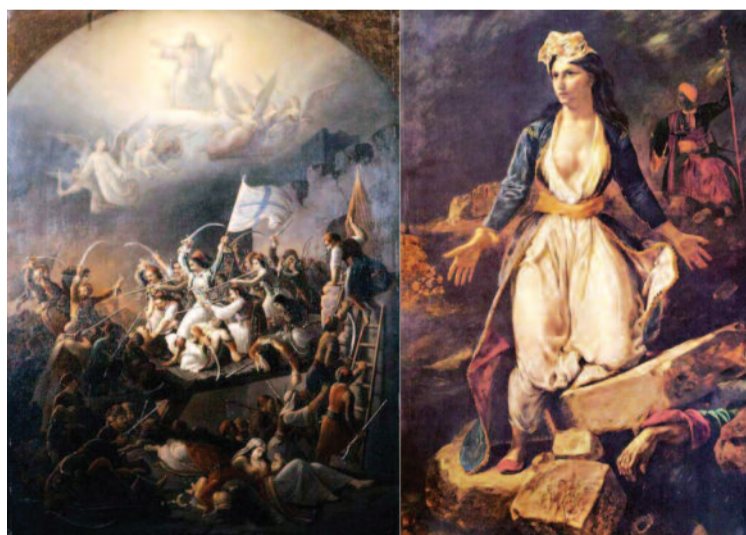
Η ηρωική Έξοδος του Μεσολογγίου και "Η Ελλάς στα ερείπια του Μεσολογγίου", έργο του Ευγένιου Ντελακρούά, 1826.

«Φυλάξου μην κλείσει η μυστική ρωγμή της μνήμης κι εσύ απομείνεις μόνος στις κερκίδες με τη σπασμένη σάλπιγγά σου» Γιάννης Δάλλας - ποιητής, συγγραφέας, δοκιμογράφος